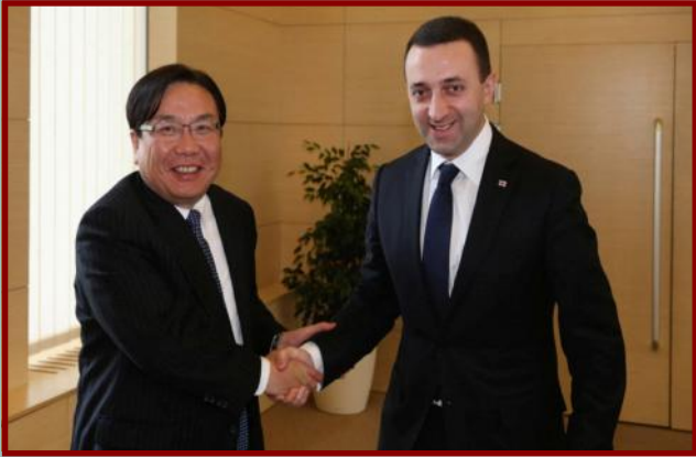
საქართველოს პრემიერ-მინისტრი ირაკლი ღარიბაშვილი აზიის განვითარების ბანკის ვიცე-პრეზიდენტს ვენჩაი ჟანგს შეხვდა. პრემიერმა აზიის განვითარების ბანკს მადლობა გადაუხადა თბილისში საერთაშორისო საინვესტიციო ფორუმის ორგანიზებისთვის, რომლის ფარგლებში 100-ზე მეტი მაღალი რანგის სტუმარი სხვადასხვა ქვეყნიდან, საქართველოს საინვესტიციო შესაძლებლობებს გაეცნო. ფორუმის მონაწილე ბიზნესმენები